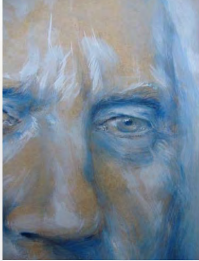
Dessin à l'encre du ciel par Frédérique Lemarchand, artiste peintre, lemarchand-peintre.com